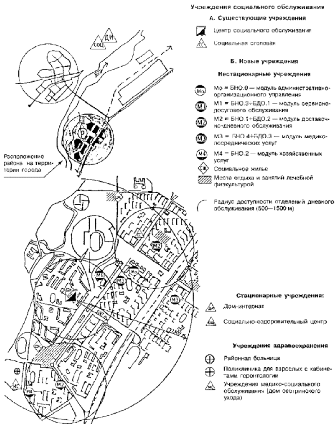
Рисунок 6.2 - Блок-модульный метод размещения учреждений социального обслуживания пожилых людей в сложившемся районе города